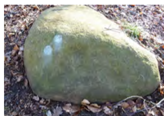
Spor efter savgraven ved post 3.